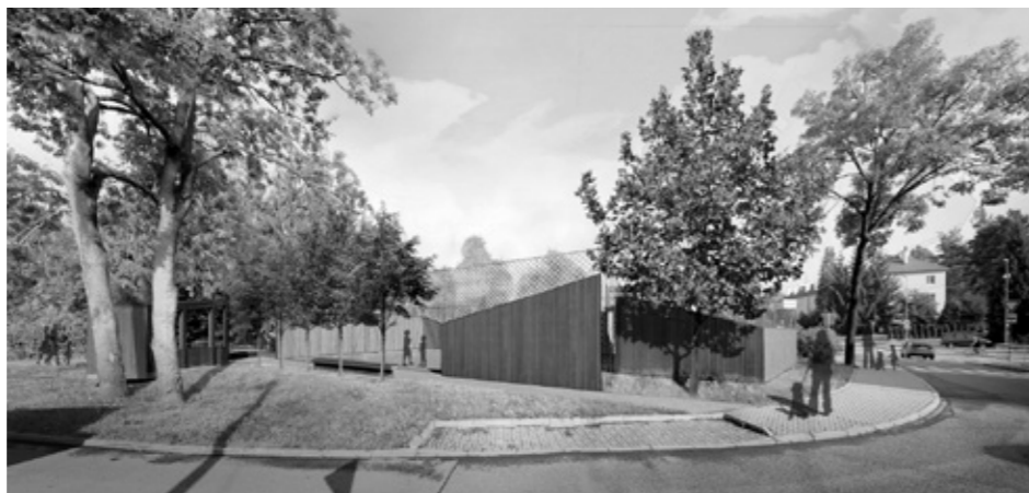
Kramolišov – hřiště

Sport – podporujeme modernizaci školních hřišť (letos by mělo být dokončeno hřiště ZŠ Videčská, příští rok by měla být dokončena hřiště u ZŠ Videčská a ZŠ 5. května) a jejich přístupnost veřejnosti v době, kdy je nevyužívá škola. Ve městě v uplynulém období s naší podporou vznikl také skatepark a workoutová hřiště, rekonstrukcí prošlo hřiště u ZŠ Pod Skalkou, připraveno k realizaci je i hřiště u mostu na Kramolišově. Dostupnost sportovišť je spojována nejen s lepší fyzickou kondicí, ale je také prevencí sociálně-patologického cho-