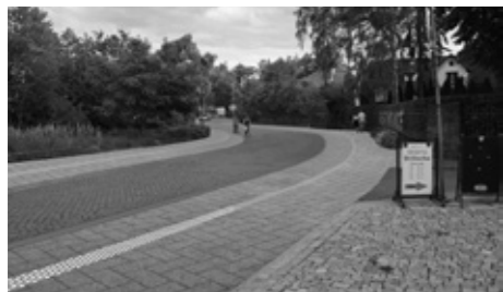
Návrh úprav Bezručovy ulice

Bezručova ulice je jednou z historických ulic, Zdravý Rožnov podporuje a prosazuje plán na její rekonstrukci, která by historickou linku podpořila a provoz na ulici udržela zhruba ve stávajícím stavu. Domníváme se, že „Bezručka“ by měla vyvažovat ulice, kde dostala přednost automobilová doprava (zejména I/35 a ulici 5. května), a měla by poskytovat stejný prostor autům, cyklistům a chodcům. Spojuje ostatně dvě základní školy, Středisko volného času, kino, knihovnu, ZUŠ. A přibývají na ní i nové cíle, ať už jde o Brillovku nebo plánované kulturní centrum a přístavbu knihovny. I tyto nové cíle si zaslouží kultivovaný veřejný prostor, který by na ně navazoval. „Bezručka“ má nakročeno k tomu, stát se kulturní tepnou města, ulicí se zachovanou žulovou kostkou, přímo navazujícím prostorem pro cyklisty a pro chodce by tomu měla odpovídat. Plán by se dal realizovat za pět let, kdy nám Zlínský kraj Bezručovu ulici převede. Do té doby jsme se dohodli na jejím předlážďení, ať nepřipomíná spíš tankodrom.